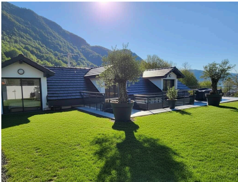
Bourget-du-Lac - Appartement d'exception en dernier étage avec toit-terrasse.

Situé au dernier étage d'une résidence récente de 2023 avec ascenseur, découvrez ce superbe appartement de 105 m², accès privatif à votre appartement depuis l'ascenseur. Vous êtes seul au dernier étage !